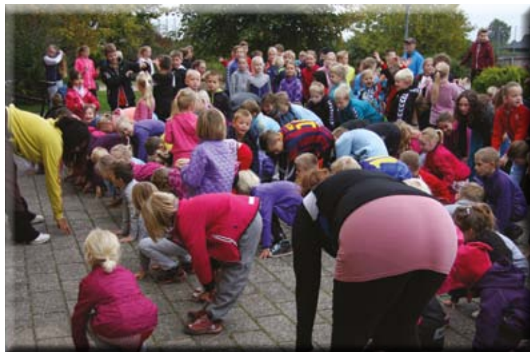
Fælles opvarmning til Skolernes Motionsdag.

I en proces, der involverede medarbejdere fra alle afdelinger og bestyrelsen, har vi vedtaget følgende værdier som overordnede pejlemærker for landsbyordningen: Gensidig respekt, Tryghed, Udvikling og Alles ret til et godt fællesskab. I de enkelte afdelinger er personalet godt i gang med at implementere værdierne.