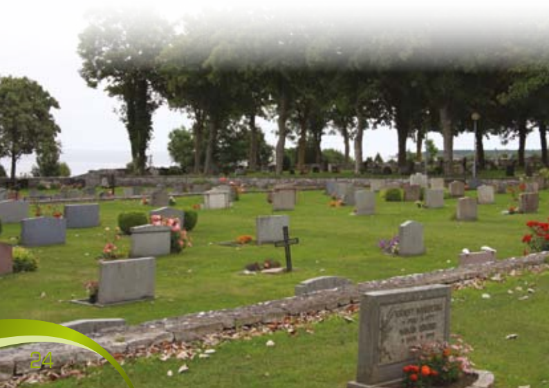
En typisk kirkegård.