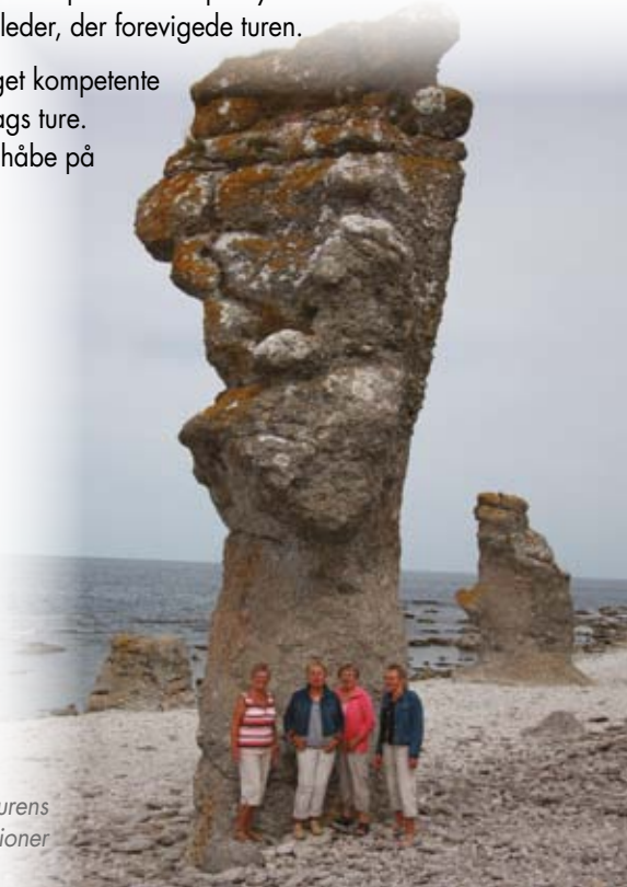
Nogle af naturens egne konstruktioner