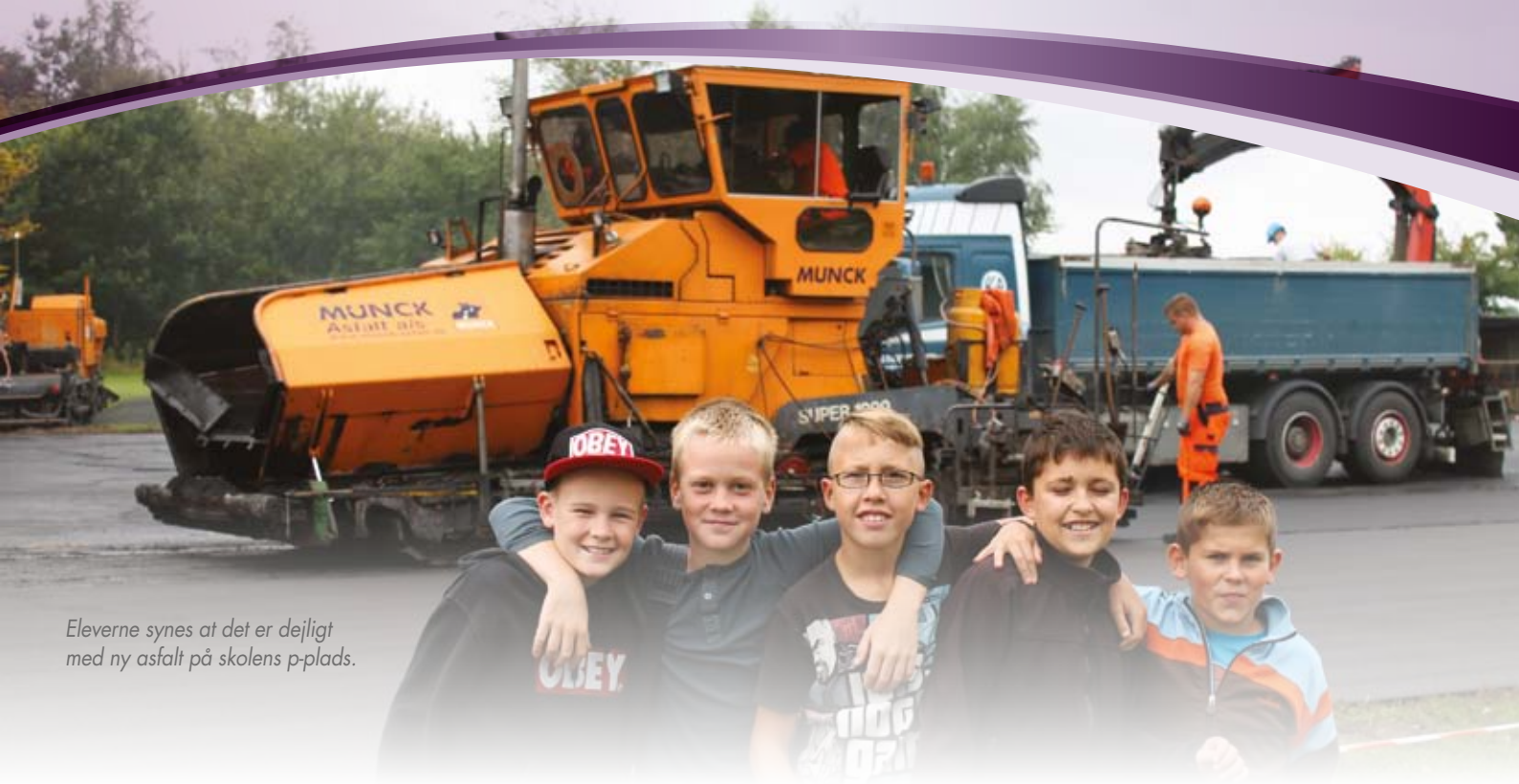
Eleverne synes at det er dejligt med ny asfalt på skolens p-plads.

skærm i tavlestørrelse, som er koblet til en computer. Det åbner for en aktiverende undervisning, som tiltaler eleverne. Det er meget vigtigt, at de nye muligheder bliver brugt for at højne kvaliteten og interessen i skolen. Derfor støtter fællesbestyrelsen op om uddannelse og vidensdeling mellem lærerne i god brug af de digitale medier. Der er i flere fag indkøbt nye bøger, der understøttes af de interaktive tavler og internetbaserede programmer. Men vi skal ikke glemme de skønne omgivelser og de muligheder, de giver for bevægelse. Vi skal bruge dem. Vi SKAL bruge dem til at få mere bevægelse og afveksling ind i undervisningen ifølge den nye undervisningsreform. Vi har helt unikke omgivelser i landsbyordningen - det er bare med at bruge dem. Gå en tur rundt om skolen, Verringe Skovservice har bygget en ny legeplads, tag et smut gennem skoven lige ved siden af Brylle børnehave, hvor børnene vinker fra bakkerne, og følg kanten af marken op mod Agerholm og nyd landskabet og dyrelivet der. Der er kommet hegn rundt om, men lågerne kan åbnes.