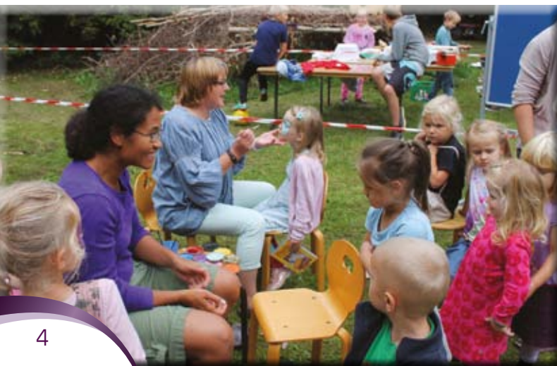
Mange børn blevet malet i hovedet til landsbyfesten.

Vi er ved at tage skridt ind i den digitale alder: Antallet af PC'er er øget, der er etableret nyt computerlokale i tilknytning til SFOen, og iPads er taget i brug, både i børnehaver og skole. Desuden er de nye interaktive tavler taget i brug i alle klasser i skolen. Her tegner og skriver man direkte på en