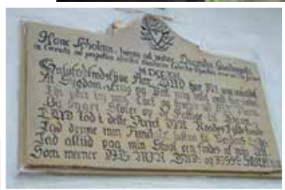
Rytterskolen i Brylle, som i dag huser Lokalhistorisk Arkiv samt legestue for dagplejen.