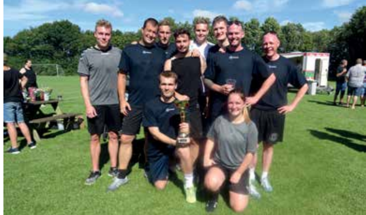
1. pladsen fik ASH Service