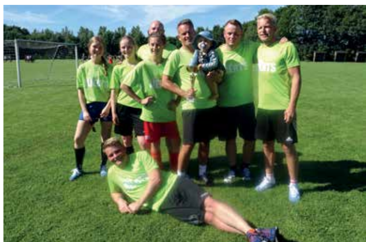
2. pladsen gik til Media Alerts

Man skal lige tænke på, at det er kun for sjov, der bliver spillet, og det drejer sig om at have det sjovt og hygge sig med hinanden.